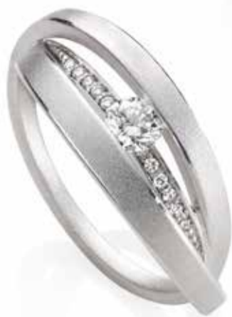
„Jubiläumsring“ Schmuckwerk Ltd. Edition 25