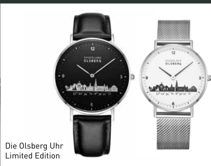
Die Olsberg Uhr Limited Edition