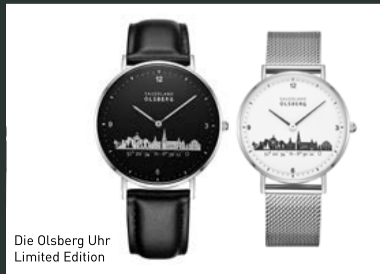
Die Olsberg Uhr Limited Edition